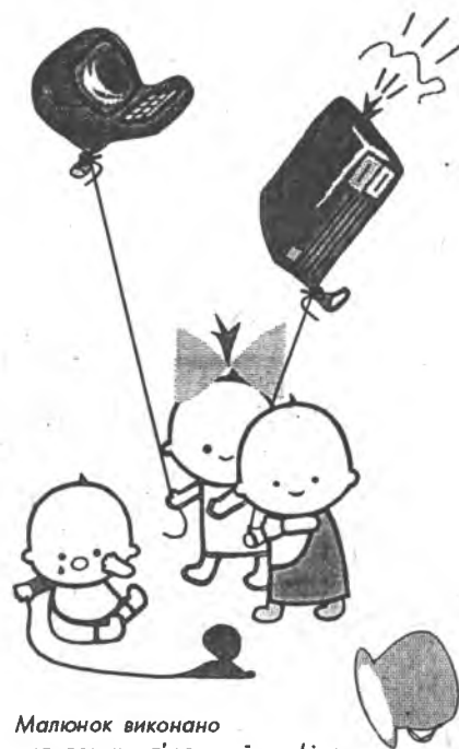
Малюнок виконано методом комп'ютерної графіки