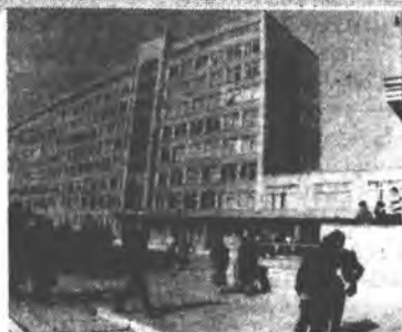
Газета Прикарпатського університету

4 січня о 5 годині посього часу Земля буде у перигелії, тобто на найменшій відстані від Сонця. 20 січня Сонце вступить у зодіакальний знак Водоля.